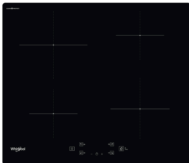
Table de cuisson à induction Whirlpool - WS Q3560 CPNE

4 feux à induction. cette table de cuisson à induction Whirlpool présente les caractéristiques suivantes : Une technologie toute en élégance qui chauffe la poêle, pas la plaque, ce qui limite la dperdition énergétique et permet une cuisson parfaite. Alimentation électrique.